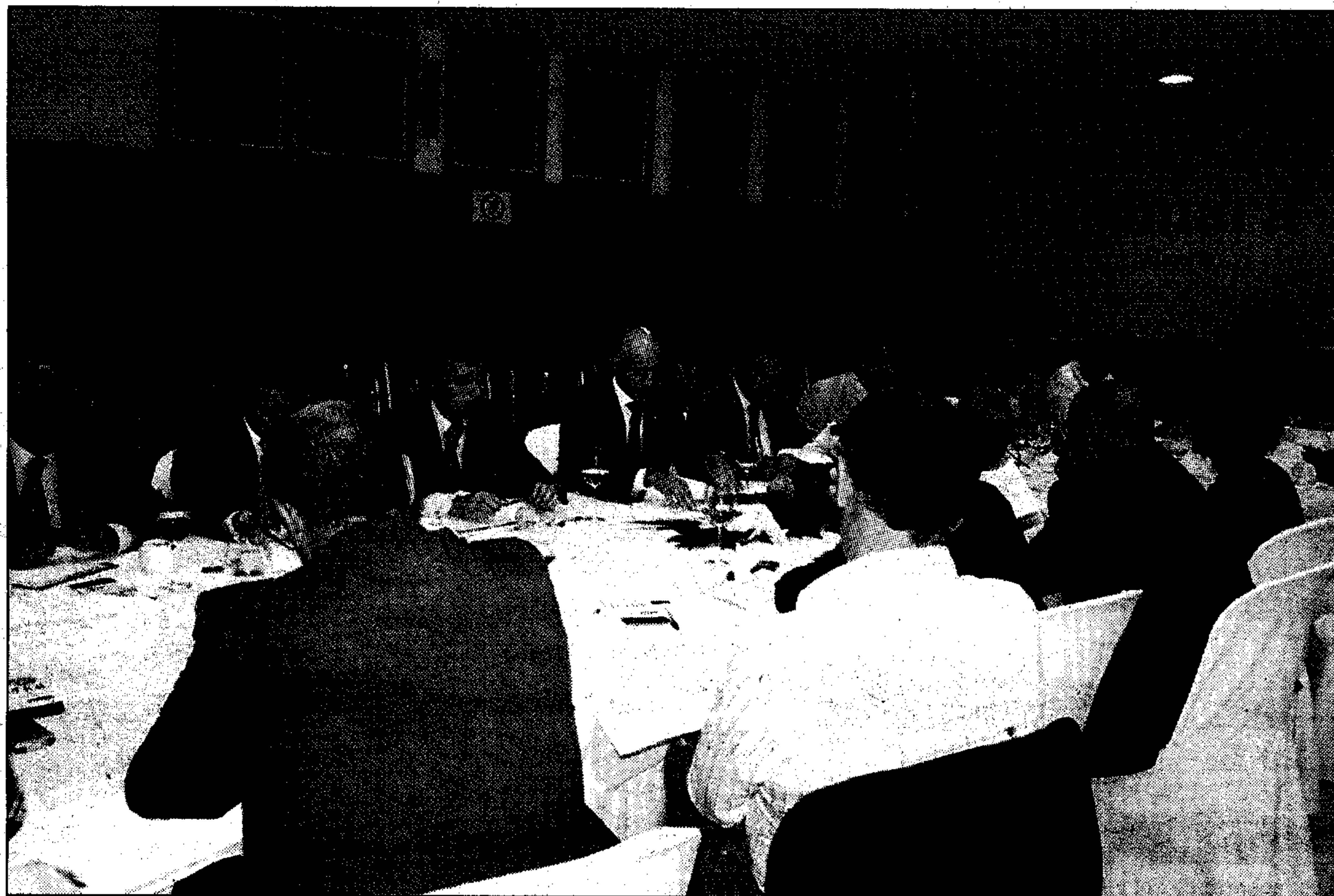
Reunión del Pleno de la Cámara de Comercio, integrado por 34 empresarios que representan la economía almeriense.

En este contexto, la institución cameral, si bien ha realizado un análisis sectorial, se ha centrado principalmente en un plano más general para definir una serie de medidas y propuestas, que a modo de recetas, son de aplicación en dos vertientes: en el ámbito empresarial y en el ámbito de las Administraciones.