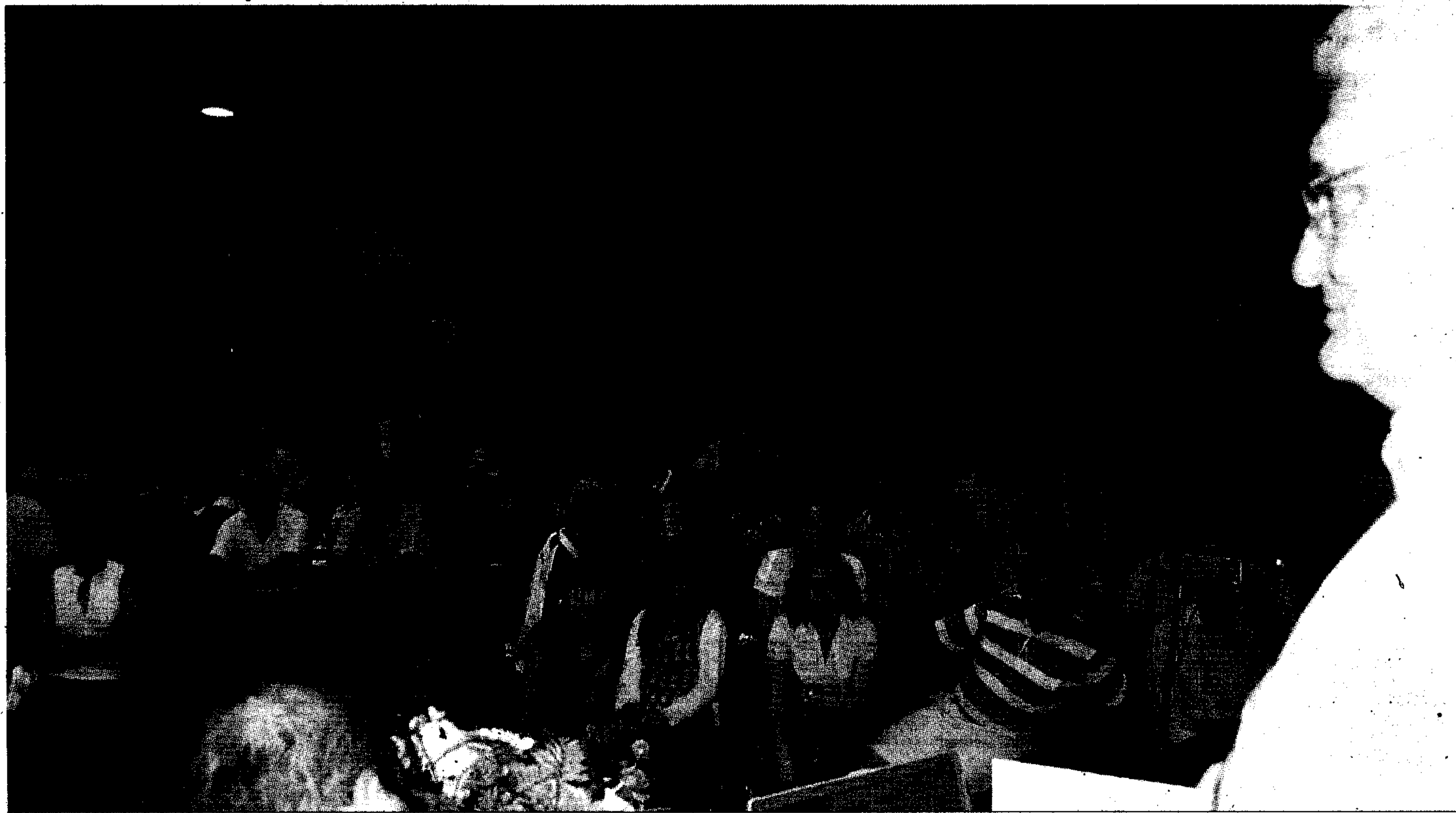
La jornada organizada por Vega Cañada contó con un nutrido grupo de asistentes.